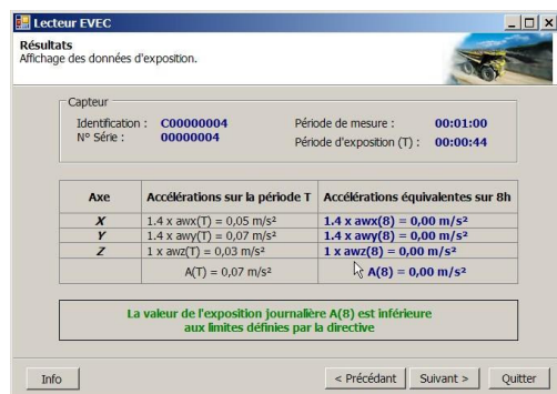
VecSensorDuo : affichage du A(8)